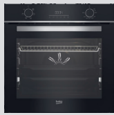
FOUR CATALYSE BBIE18300XS classe A, cavité 72L (prix unitaire indicatif: 410€, dont 10€ d'éco part DEEE inclus)