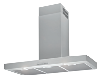
HOTTE BOX HKC90X2 90cm Airforce, classe C, Aspiration maxi 650 m³/h, Niveau sonore mini 49 dB(A), maxi 68 dB(A) (prix unitaire indicatif: 324€, dont 5€ d'éco part DEEE inclus)