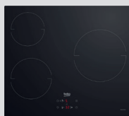
PLAQUE INDUCTION HII634PS 3 foyers, puissance totale 5900W (prix unitaire indicatif: 355€, dont 5€ d'éco part DEEE inclus)