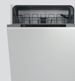
LAVE-VAISSELLE PDIN2531I classe E, 13 couverts, 47 dB(A) (prix unitaire indicatif: 518€, dont 8€ d'éco part DEEE inclus)

Ajoutez un évier & un mitigeur et faites 25% d'économie