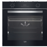
FOUR CATALYSE BBIE18300XS classe A, cavité 72L (prix unitaire indicatif: 410€, dont 10€ d'éco part DEEE inclus)