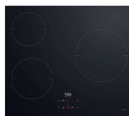
PLAQUE INDUCTION HII634PS 3 foyers, puissance totale 5900W (prix unitaire indicatif: 355€, dont 5€ d'éco part DEEE inclus)