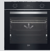
FOUR CATALYSE BBIE18300XS classe A, cavité 72L (prix unitaire indicatif: 410€, dont 10€ d'éco part DEEE inclus)