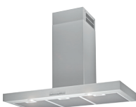
HOTTE BOX HKC90X2 90cm Airforce, classe C, Aspiration maxi 650 m 3 /h, Niveau sonore mini 49 dB(A), maxi 68 dB(A) (prix unitaire indicatif: 324€, dont 5€ d'éco part DEEE inclus)