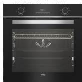
FOUR CATALYSE BBIE18300XS classe A, cavité 72L (prix unitaire indicatif: 410€, dont 10€ d'éco part DEEE inclus)