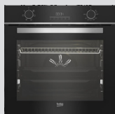
FOUR CATALYSE BBIE18300XS classe A, cavité 72L (prix unitaire indicatif: 410€, dont 10€ d'éco part DEEE inclus)