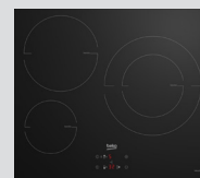
PLAQUE INDUCTION HII63402MT 3 foyers, puissance totale 7200W (prix unitaire indicatif: 395€, dont 5€ d'éco part DEEE inclus)