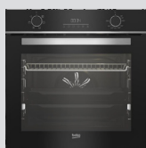
FOUR CATALYSE BBIE18300XS classe A, cavité 72L (prix unitaire indicatif: 410€, dont 10€ d'éco part DEEE inclus)