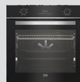
FOUR CATALYSE BBIE18300XS classe A, cavité 72L (prix unitaire indicatif: 410€, dont 10€ d'éco part DEEE inclus)