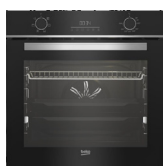
FOUR CATALYSE BBIE18300XS classe A, cavité 72L (prix unitaire indicatif: 410€, dont 10€ d'éco part DEEE inclus)