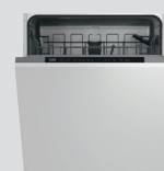
LAVE-VAISSELLE PDIN2531I classe E, 13 couverts, 47 dB(A) (prix unitaire indicatif: 518€, dont 8€ d'éco part DEEE inclus)

Ajoutez un évier & un mitigeur et faites 25% d'économie