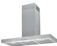
HOTTE BOX HKC90X2 90cm Airforce, classe C, Aspiration maxi 650 m 3 /h, Niveau sonore mini 49 dB(A), maxi 68 dB(A) (prix unitaire indicatif: 324€, dont 5€ d'éco part DEEE inclus)