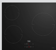
PLAQUE INDUCTION HII634PS 3 foyers, puissance totale 5900W (prix unitaire indicatif: 355€, dont 5€ d'éco part DEEE inclus)