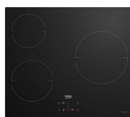
PLAQUE INDUCTION HII634PS 3 foyers, puissance totale 5900W (prix unitaire indicatif: 355€, dont 5€ d'éco part DEEE inclus)